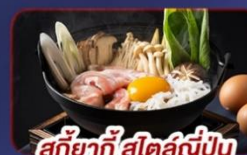
สุกียากี้ สดล่ขุ่น