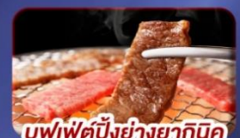
บุฟเฟ่ต์บิงย่างยากินิกุ