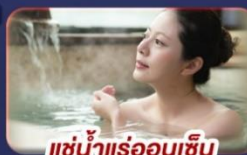
แช่น้ำแร่ออนเซ็น